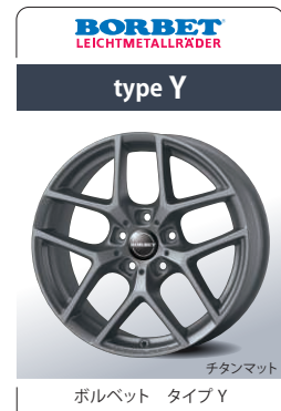
ボルベット タイプ Y